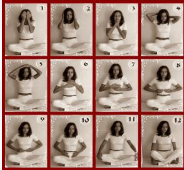
12 posiciones básicas para autotratoamiento

La mejor manera de iniciarse en la práctica de reiki es comenzar con uno mismo. Inicialmente reiki puede ser utilizado por la propia persona como una manera de aprendizaje y familiarización de las posiciones básicas. Una vez que el principiante haya asimilado convenientemente dichas posiciones, éstas serán útiles para el propio desarrollo personal posterior (limpieza, armonización y potenciación).