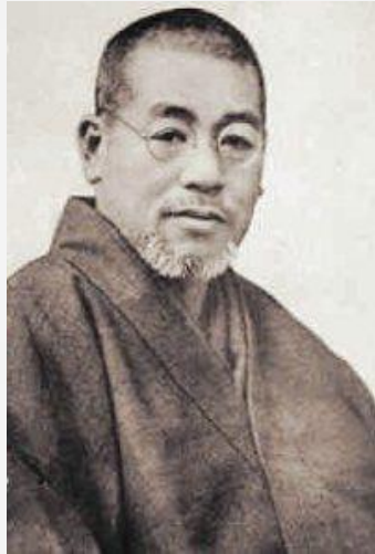
Sensei Mikao Usui (1865-1926)

El Reiki fue propuesto por primera vez por el Sensei japonés Mikao Usui a inicios del siglo XX. Cuenta la tradición que Usui era un eterno buscador de la verdad y su interés primordial era lograr una manera de sanar integrando cuerpo, mente y espíritu. Cuando Usui propuso el Reiki a la humanidad tuvo en un inicio marcadas influencias en el budismo, shintoísmo y hasta en el cristianismo, probablemente Usui se basó en el ejemplo de personajes como Buda y Jesús, pues ellos tenían el don de la sanación divina a través del uso de las manos.